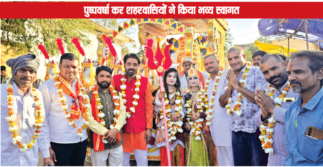
पुष्यवर्षा कर शहरवासियों ने किया भव्य स्वागत